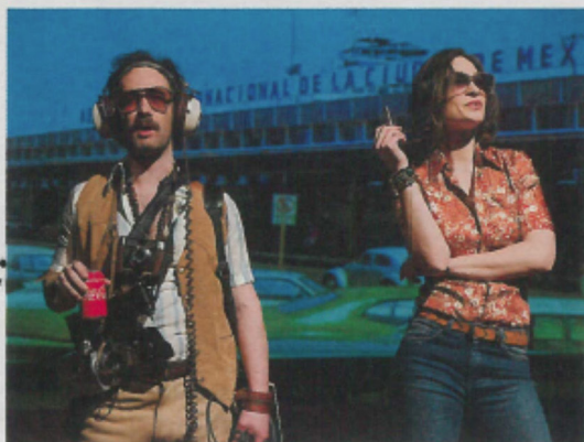
Une plongée infernale dans le destin du mystérieux écrivain B. Traven.