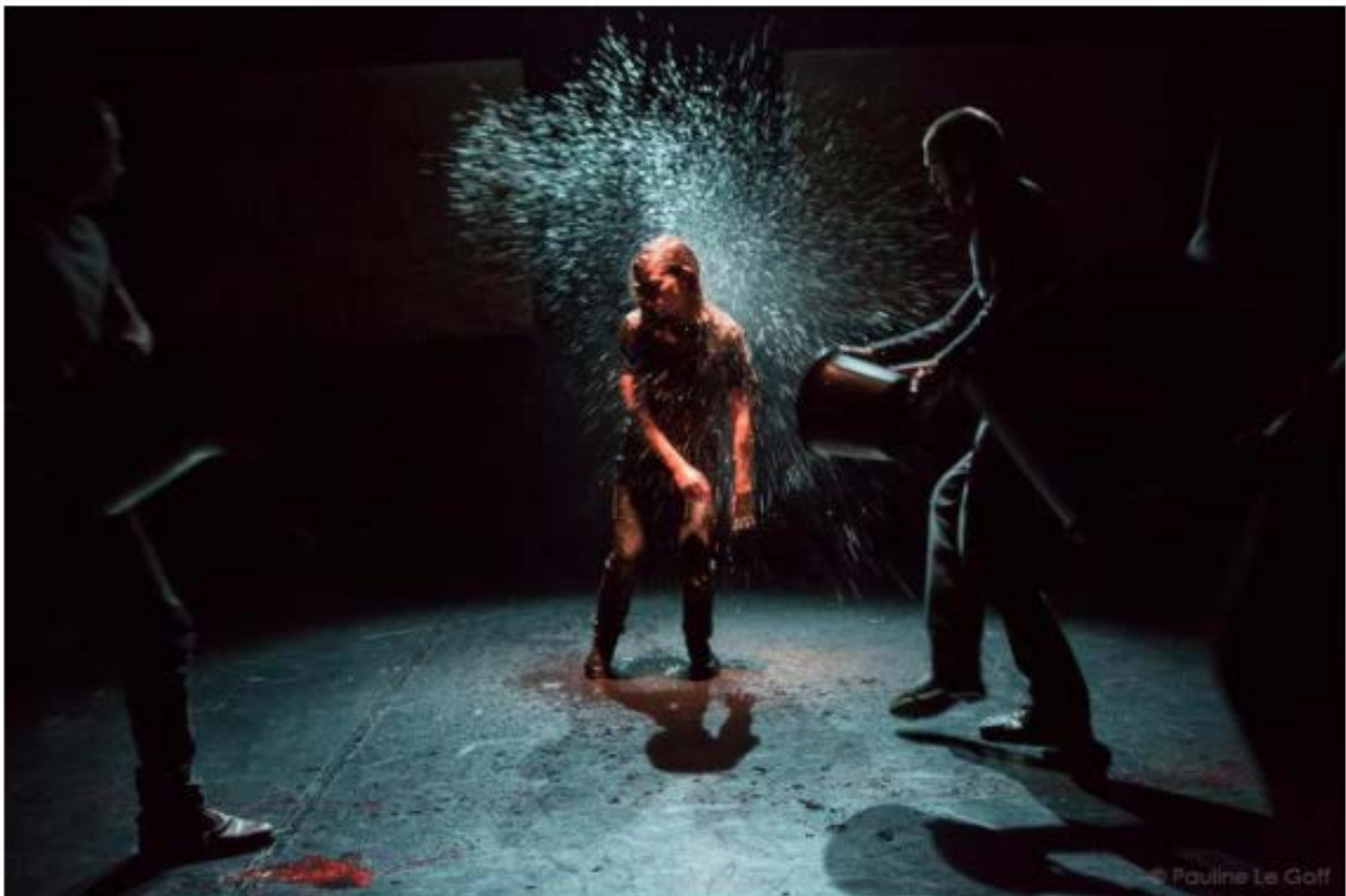
Scène de l'«Iliade»

« Maman ! » appelle Achille, comme un enfant blessé, humilié par la tricherie de l'un de ses camarades de jeu. Ce n'est plus un enfant, c'est un guerrier, le meilleur de tous, mais c'est aussi un homme à qui celui auquel il doit le respect, Agamemnon, vient de formuler des exigences qu'il estime injustes et injustifiées. Blessé dans son orgueil, cédant, in fine, à regret, il laisse partir « la fille » au centre de l'enjeu mais refuse de repartir à la guerre. Neuf ans qu'il combat les Troyens, stop, il se retire. Il sait que, sans lui, les décisifs combats futurs seront incertains, tous le lui disent, il s'obstine. S'éloignant, seul à l'écart, il pleure. Assis sur une chaise dos au public, il appelle : « Maman ! » C'est la première scène du spectacle Iliade , après le prologue qui s'est déroulé dans le hall du théâtre.