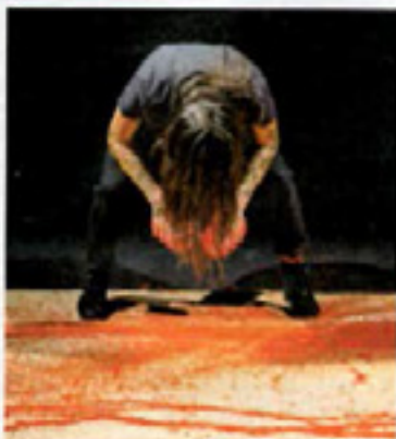
Homère... admirablement massacré.