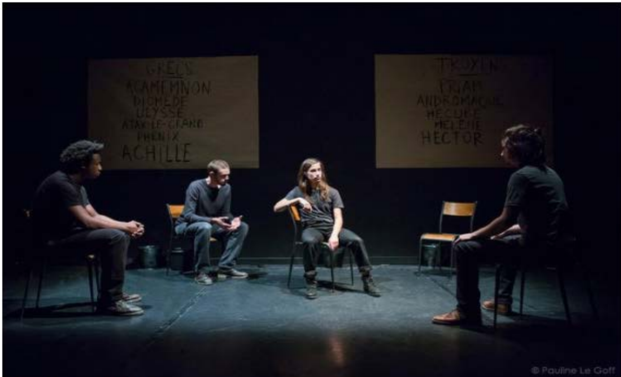
Scène de l'"Iliade" © Lorine Baron

Le traitement des dieux qu'elle opère et qui peut surprendre ne fait que prolonger la façon éminemment terrestre induite par Homère. Quand Thétis veut aller auprès de Zeus plaider la cause de son fils, ce dernier est parti participer à un banquet chez les Ethiopiens, et tous les dieux l'ont suivi. Chez Homère, les dieux passent leur temps à bouffer, à intriguer, à séduire, à baiser, à faire la pluie, le vent et le beau temps. Il leur arrive aussi de prendre une apparence humaine pour jouer des tours ou s'amuser. Ils sont proches de nous. Ainsi la déesse Iris prend l'apparence de la belle-sœur d'Hélène et lui dit : « Viens ma chère, viens voir : l'histoire est incroyable ! » Cette phrase est extraite non de l'adaptation de Pauline Bayle mais bien de la docte traduction de Paul Mazon publiée dans les années 1930.