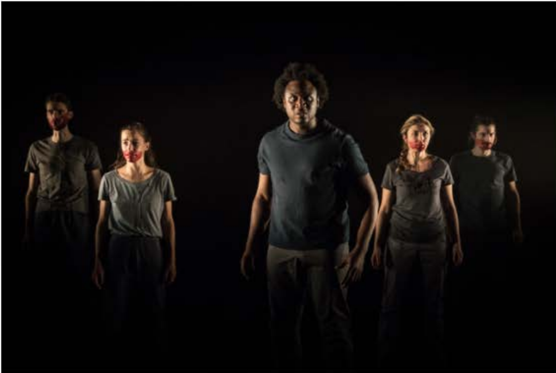
Scène de l'"Odyssée"

Une carte de vœux envoyée par un ami a pour seul texte une phrase du peintre André Derain : « Rien n'est plus difficile que la simplicité. » Telle est bien la visée de Pauline Bayle pour ce diptyque que forment l' Iliade et l' Odyssée .